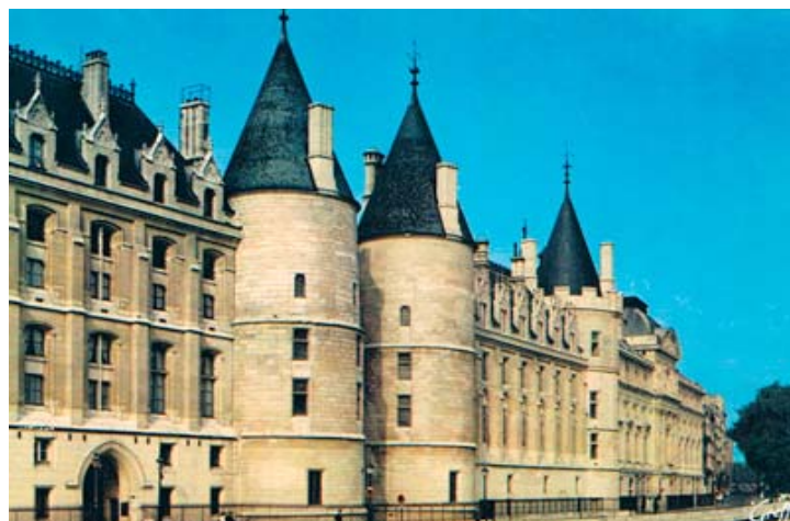
La Conciergerie, mittelalterliches Palais, Sitz des Revolutionstribunals, Vorzimmer des Todes genannt.

Mary Wollstonecraft, London, die bekannte Autorin von "Zurückforderung der Rechte der Frauen", 1792