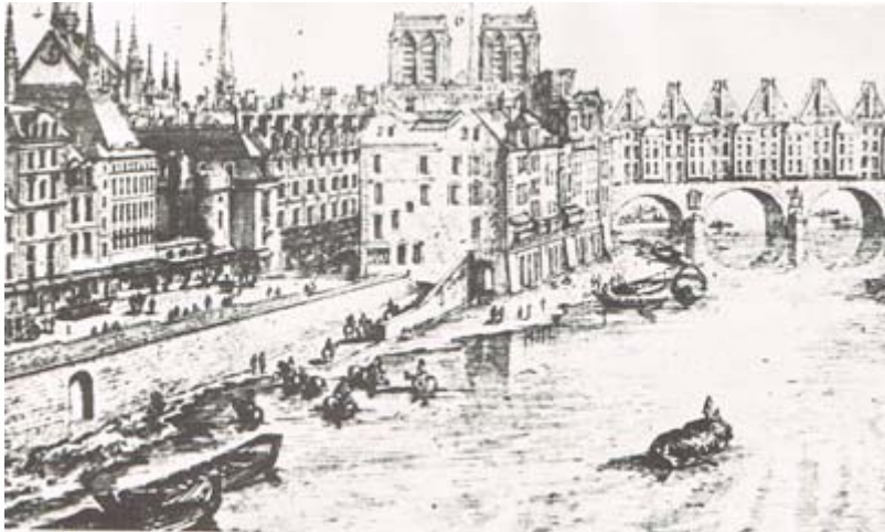
Paris im 18. Jahrhundert"