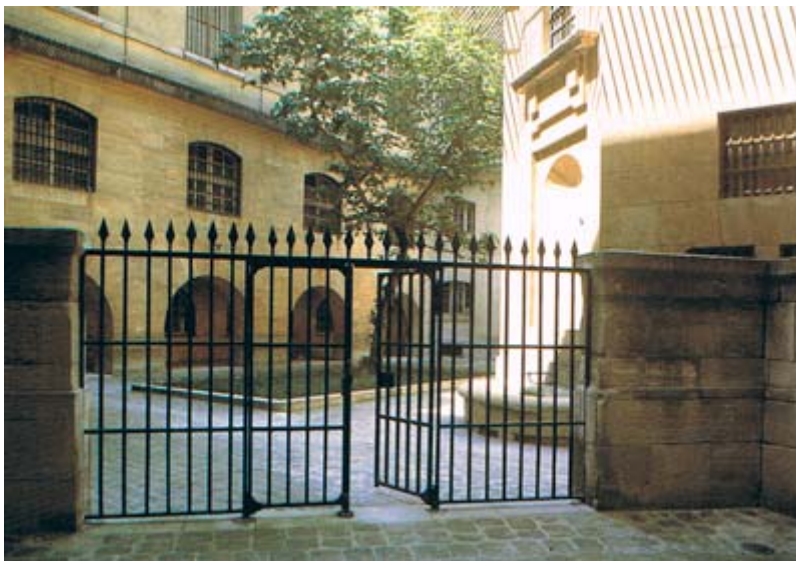
“Hof der Frauen im Gefängnis der Conciergerie; rechts der Brunnen, an dem die gefangenen Frauen sich und ihre Kleidung waschen mußten.”

Jede Verfassung ist null und nichtig, wenn die Mehrheit der Nation, Mütter, Töchter und Schwestern, an der Verfassungsgebung nicht mitgewirkt hat!